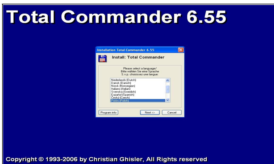
Rysunek 1. Okno powitalne instalatora Total Commander'a

Na początek ściągamy plik instalacyjny ze strony producenta, a następnie go uruchamiamy. Plik jest mały, tak więc nie powinno być problemów ze ściągnięciem go z Internetu (zajmuje około 1,6 MB).