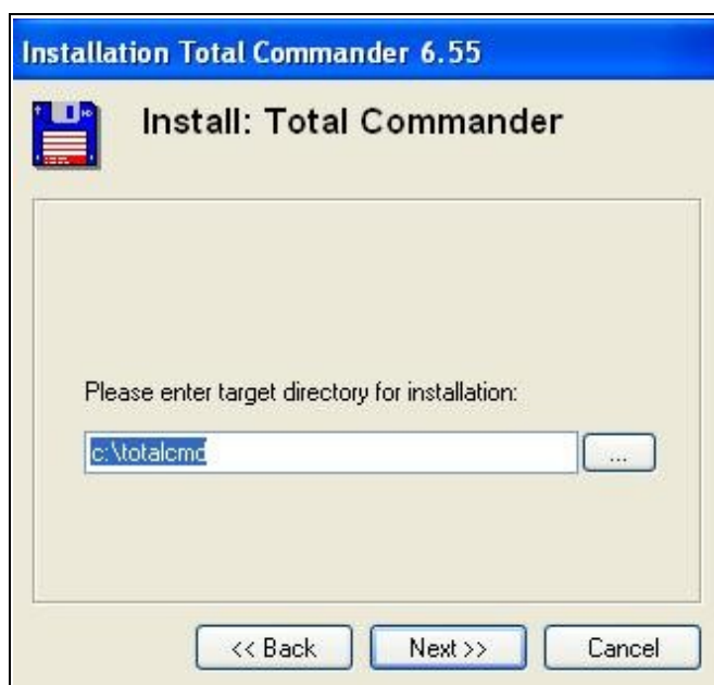
Rysunek 2. Ścieżka do instalacji programu.

W kolejnym kroku instalator zapyta nas gdzie chcemy zainstalować program. Domyślnie jest to c:\totalcmd. Po wybraniu ścieżki instalacji programu klikamy w następnych krokach na „Next”. Po zakończeniu instalacji program jest gotowy do użycia.