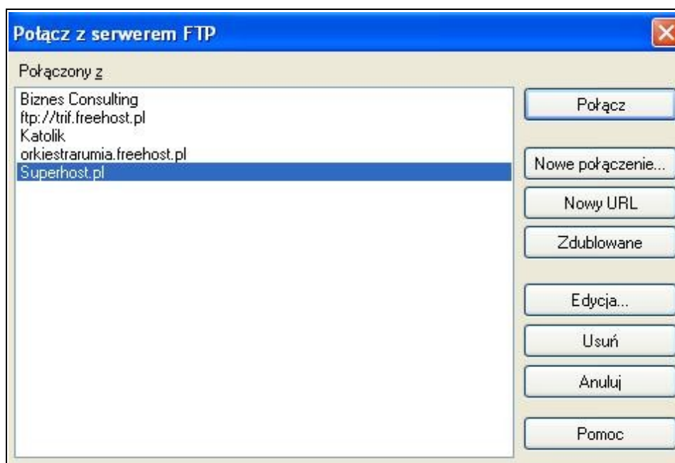
Rysunek 3. Konfiguracja połączenia.

Następnie wybieramy przycisk „Nowe połączenie”.